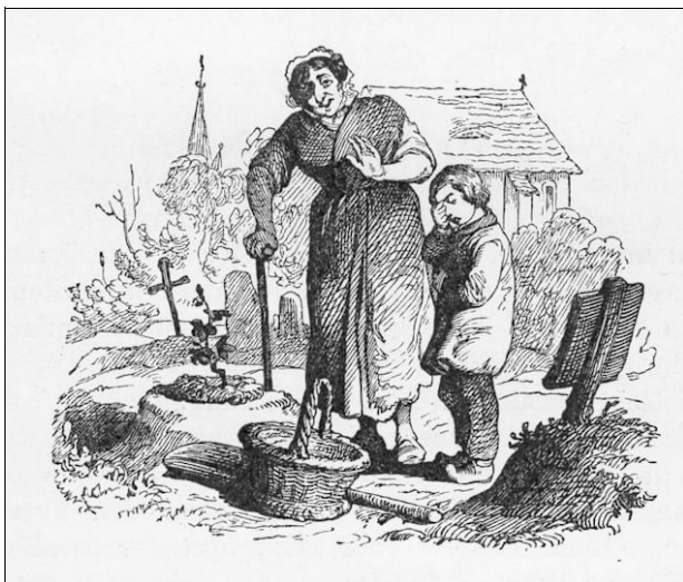
Tegning af Vilhelm Pedersen (1820-1859) til H.C. Andersen eventyr ” Hun duede ikke”.